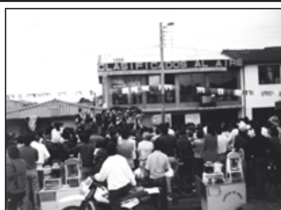
Sala de EXHIBICIÓN Calle 13 Carrera 11 esquina

NO CONTAMINEMOS EL AGUA, NO ENVENENEMOS NUESTRA FUENTES DE VIDA.